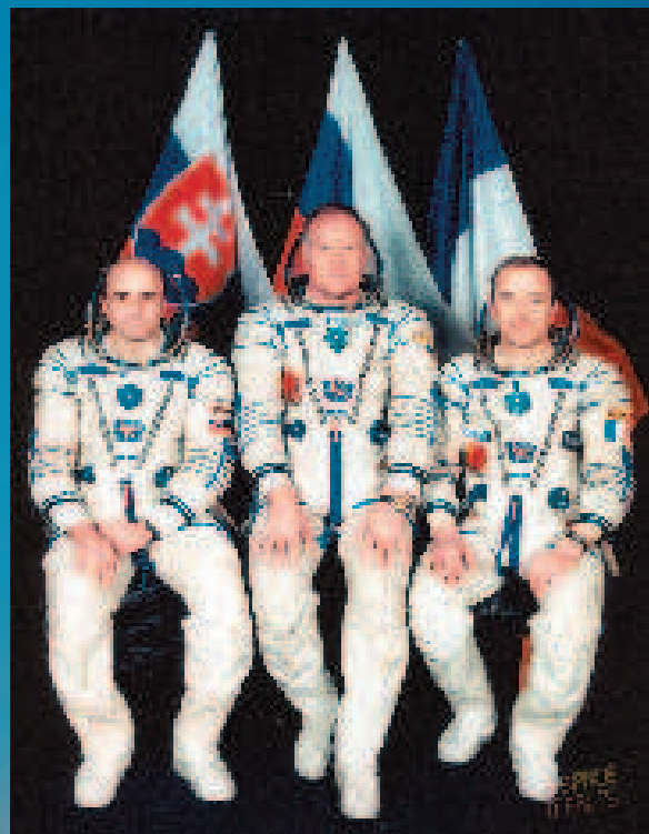
Posádka letu SOYUZ TM - 29

Mire bol SK-5 TRÉNING, teda štúdium vytrvalostného tréningu kozmonautov v predletovej príprave a získanie neuroendokrinnnej a kardiovaskulárnej odpovede na rozličné stresy. Poslednou Bellovou úlohou bola SK-6 PREPELICA, výskum zabezpečenia života za hranicami