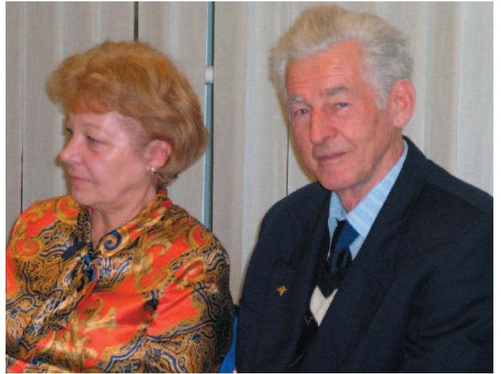
S manželkou na výročnej schôdzi KVV