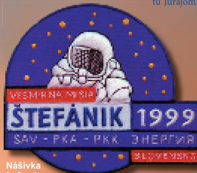
Nášivka skafandra letu SOYUZ TM - 29

teda aj pocitmi ilúzií, príčinami dezorientácie vestibulárneho aparátu a ich odstránením. Najdôležitejšia čas slovenského výskumu na Mire bol SK-3 ENDOTEST - získanie neuroendokrinnnej a metabolickej odpovede kozmonautov na záťaž v predletovej príprave, pri kozmickom lete a počas adaptácie po jeho skončení. Teda získanie originálnych vedeckých poznatkov o zmenách hladín rôznych hormónov v krvi a posúdiť tak stupeň stresogenosti kozmického letu, trénovanosti organizmu a schopnosti zvládnuť stresové stavy a pracovné nároky na palube. Tento projekt a s ním aj SK-4 METABOLIZMUS skúmal metabolické dôsledky zníženej fyzickej aktivity u kozmonauta počas letu a u vytrvalostne trénujúcich osôb na Zemi. Zhrnutím dvoch predošlých bodov programu I. Bellu na