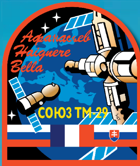
Oficiálny znak letu SOYUZ TM - 29