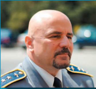
Ivan Bella * 25. 2. 1964

V Bratislave bola 20.2.2019 konferencia pri príležitosti 20-teho výročia letu prvého slovenského kozmonauta do vesmíru. Zorganizovali ju letec-kozmonaut Ivan Bella ako hositeľ a Slovenský letecký zväz. Cieľom konferencie bolo ukázať, kam sme sa odvtedy posunuli a kam sa chceme dostať, pripomenúť si to, čo sa pred 20 rokmi udialo, ale aj zbilancovať, ako sme za tých 20 rokov pokročili. Vyhodnotiť, kde sa Slovenská republika v oblasti výskumu a mierového využívania vesmíru nachádza v súčasnosti a načrtnúť aspoň v hrubých rysoch kam a v akých časových horizontoch by sme sa v tejto oblasti chceli posunúť.