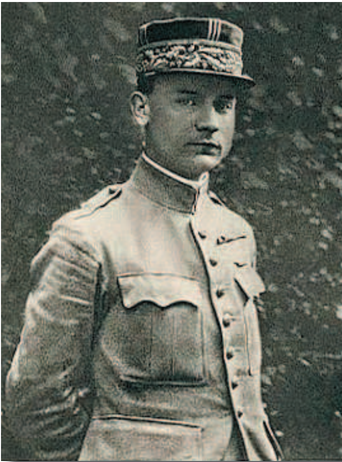
Milan Rastislav ŠTEFÁNIK * 21. 7. 1880 † 4. 5. 1919