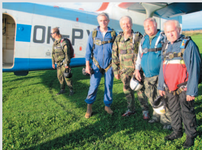
majstrovstvá KVV ČR a SR na presnosť pristátia 2010- Erpužice