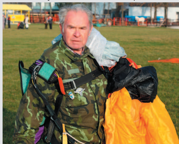
po zoskoku - Michalský deň 2010 - Partizánske

trinásti, na dva dni. Pobrali sme stany, postavili sme ich na kraji letiska – večer do kruhu k žolíkovým kartám prišlo víno. Dovtedy som pila len malinovku. Okúňala som sa. Bola som sama dievča medzi chlapcami a z každej strany znelo: „Daj si