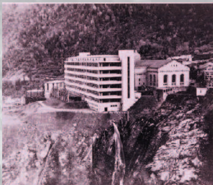
Objekt Norsk Hydro vo Vemork, stav 1942, predná budova bola odstránená v roku 1977

Pár slov pod čiarou. Firma Norsk Hydro (1907 – 1997) vyrábala hlavne chemické hnojivá, vodík, plyny, od roku 1934 ako nadbytočný vedľajší produkt i ťažkú vodu (cca 12 litrov mesačne) pre laboratórne účely. V roku 1941 bola výrobná kapacita 1500 kg, v roku 1942 už 5 000 kg ťažkej vody. Voda sa používala ako modátor (pohlčovač neutrónov) jadrovej reakcie pri výrobe plutónia z prírodného uranu U 238. Dnes tu zájemci môžu absolvovať naučnú „Cestu sabotérov“ pre pripomienku akcie. Poslednou perličkou, i keď tak trochu mimo článok je informácia, že Nórsko (so súhlasom NATO) predalo Rusku v roku 2015 námornú základňu vo fjarde Olavsern za 4,4 mil.€(!!!).