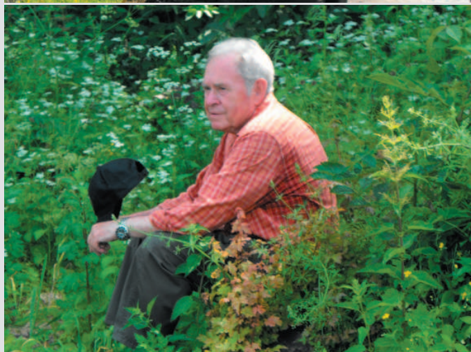
Na hrade Koralátka - 2010