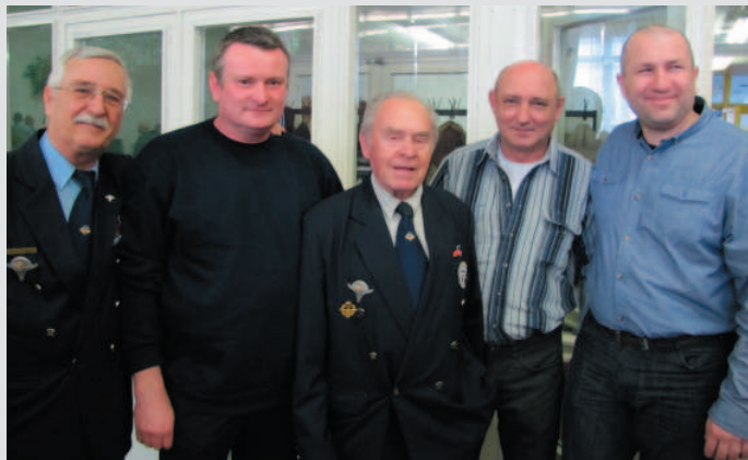
výročná schôdza KVV BA