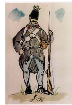
Pešiak v poľnej rovnošate z roku 1866