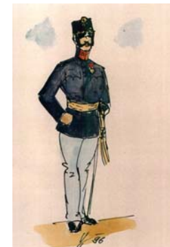
Poručik v služobnej rovnošate z rokov 1898 – 1908