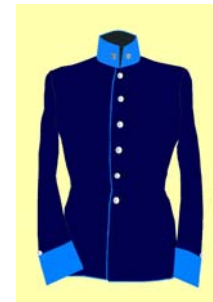
poručík 40. a 72. pešieho pluku