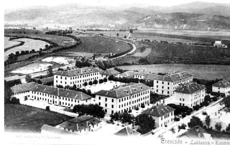
Fridrichova kasáreň v Trenčíne sa stala novým sídlom 71. pešieho pluku