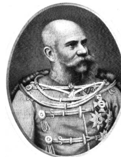
Rakúsko-uhorský cisár František Jozef I.

Krátko po zverejnení cisárskeho manifestu sa v náhradnom prápore 71. pešieho pluku v Trenčíne sústredilo asi 8 000 záložníkov. Odchádzali zo svojich domovov, opúšťali svojich najbližších a pritom zrejme mnohí z nich ani netušili, že sa vidia skutočne naposledy.