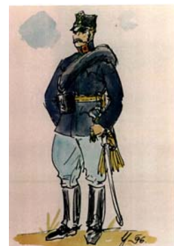
Poručik v poľnej rovnošate z roku 1878