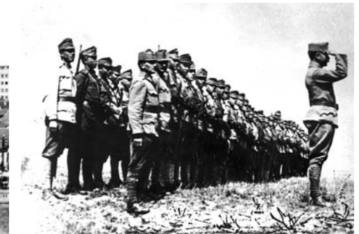
Asistenčná jednotka pred popravou na Stanovljanskom poli 6. júna 1918

Miestom popravy bolo určené Stanovljanske pole – stará srbská strelnica s násypmi na zachytávanie striel, ktoré sa nachádzalo asi kilometer od mesta. Na miesto popravy musel prísť celý náhradný prápor 71. pešieho pluku. Vojaci boli skontrolovaní, na miesto popravy mierila delostrelecká batéria a priestor obkolesil kordón dragúnov a Bosniakov. Zároveň bolo kvôli výstrahe rozkazom veliteľa mesta zvolané i domáce obyvateľstvo. Problémom bola popravná čata. Dobrovoľne sa nehlásil nik, celý náhradný prápor 71. pluku niečo také striktno odmietol. Voľba padla na G. prápor 1. bosensko-hercegovinského pluku. Z neho po hode kockou vybrali 80 mužov, ktorí dostali bohatý prídela stravy a alkohol, zároveň i pokyny. Polovica čaty mala mieriť na hlavy, polovica na hrude odsúdených.