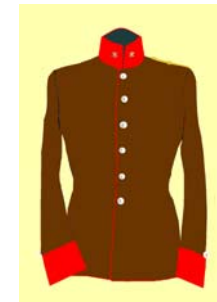
poručík C.a.K. delostrelectva