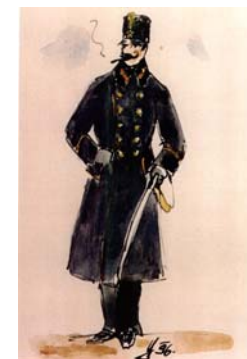
Dôstojník v plášti okolo r. 1900