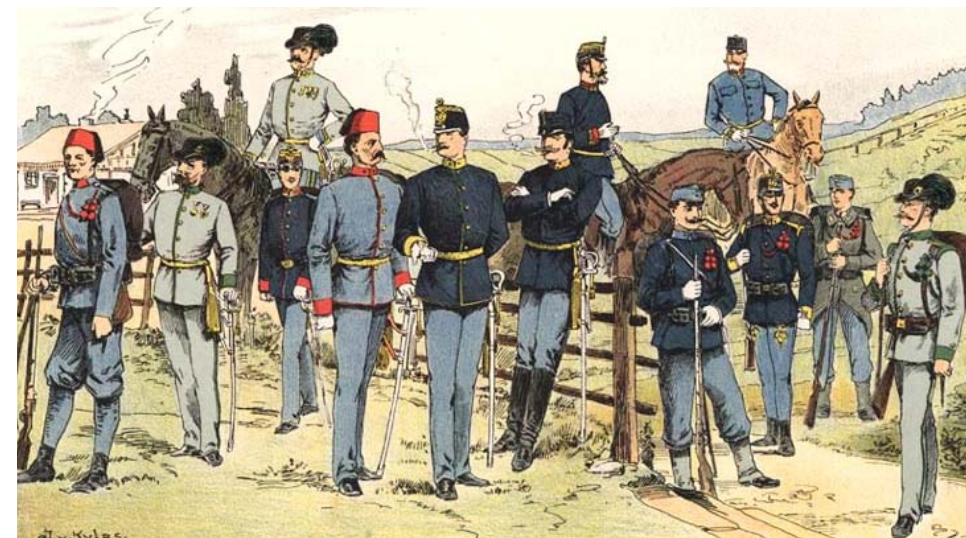
Rovnošaty pešiakov, horských strelcov a bosniansko-hercegovinskej pechoty z r. 1886

Pluky v rakúsko-uhorskej armáde sa odlišovali farbou a strihom rovnošaty, farbou výložiek, vyloženia a gombíkov, rôznym označením na výložkách, názvami hodností a pod. Pre 71. peší pluk bola pridelená tmavomodrá farba blúzy so žltými gombíkmi, pre vyloženie „račia“ červená. Rovnaká farba pre blúzy, vyloženie a gombíky boli pridelená ešte aj pre peší pluk č. 35 („rakúsky“) – pešie pluky č. 20 („rakúsky“) a 67 („uhorský“) tiež rovnaké vyloženie, ale sa odlišovali od peších plukov i č. 35 a 71 gombíkmi bielej farby.