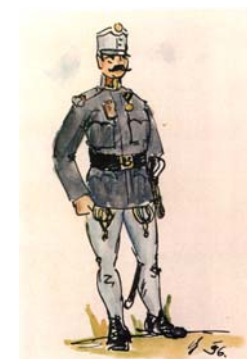
Šikovateľ v poľnej rovnošate z rokov 1890 – 1900