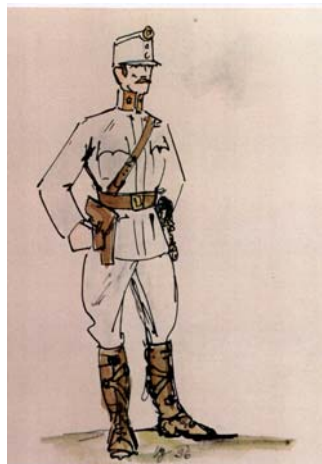
Poručík 71. pešieho pluku v poľnej rovnošate z rokov 1914 - 1916