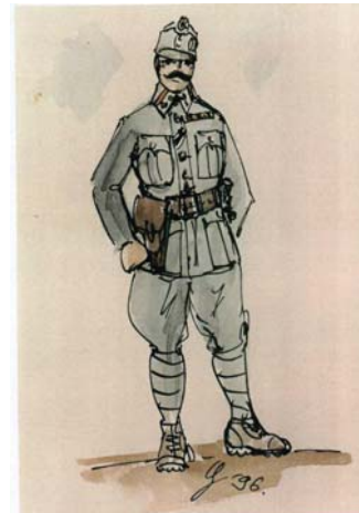
Nadporučík 71. pešieho pluku v poľnej rovnošate z r. 1917-1918

V roku 1914 boli pešiaci oblečení do jednoradových tmavomodrých poľných blúz s plukovnou egalizáciou a svetlomodrých nohavíc, ktoré u „uhorských“ plukov mali na stehnách žltočierne vyšívanie. Nosili k nim nízke súkenné čiapky so štítkom z čiernej kože. Masové používanie delostrelectva, opakovacích pušiek a guľometov na bojiskách 1. svetovej vojny si vynútilo okrem zmeny spôsobov boja aj zavedenie nových rovnošiat – v rakúsko-uhorskej armáde pre pešie pluky vo farbe poľnej šedi postupne bez farebnej plukovnej egalizácie.