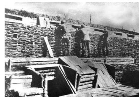
Tylová jednotka (trén) v Karpatoch a zákopy 71. pešieho pluku na talianskom fronte

Po gorlickom prielome viedol 71. peší pluk ťažké a vyčerpávajúce ofenzívne boje vo východnom Haliči a na západnej Ukrajine. Spočiatku to bola bojová činnosť v okolí mesta Sambor a v údolí rieky Ciroky, neskôr v močariskách pri Dnestri, pri Veľkom Blate, Komárne, medzi riekami Hnilá (Gnilá) Lipa a Zlatá Lipa, pri Folwarkoch a Czortkówe (dnes ukr. Čortkov). Na Ukrajine strávil pluk takmer celý nasledujúci rok. Od polovice októbra 1915 bol začlenený do prvého sledu na južnom okraji frontového úseku 2. armády, juhozápadne od Gontowa (oproti nemu sa nachádzali jednotky ruského VI. zboru 11. armády). Krvavé zákopové boje počas zimných mesiacov 1915 – 1916 pri Gontowe, Renówe, Ditkowciach a na rieke Ikva pri Kremenci predstavovali pre pluk vysoké straty na životoch jeho príslušníkov, pričom konečné výsledky samotnej bojovej činnosti boli prakticky bezvýznamné.