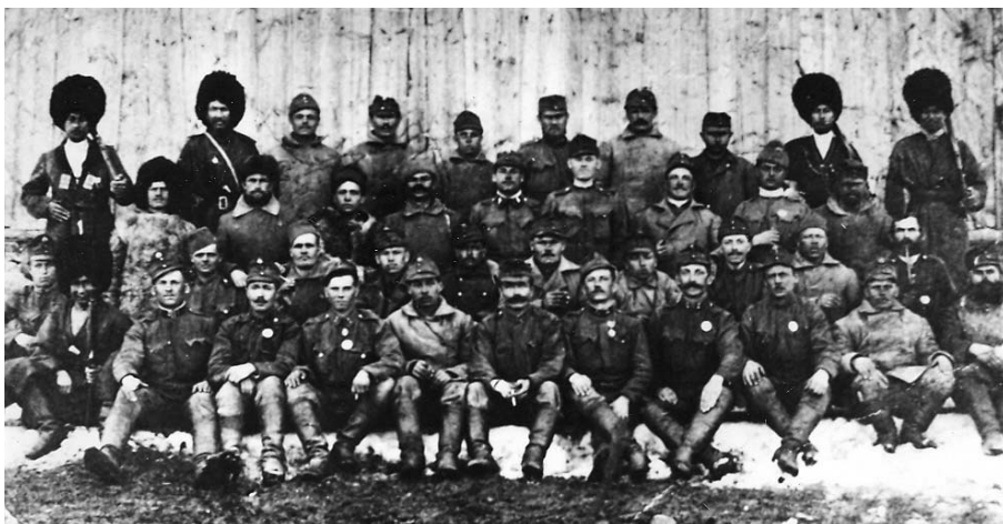
Prislušníci 71. pešieho pluku v ruskom zajatí

Publikáciu vydalo Kultúrne a metodické centrum OS SR Trenčín v roku 2008 pri príležitosti 90. výročia vzbury a popravy 44 vojakov bývalého trenčianskeho 71. pešieho pluku.