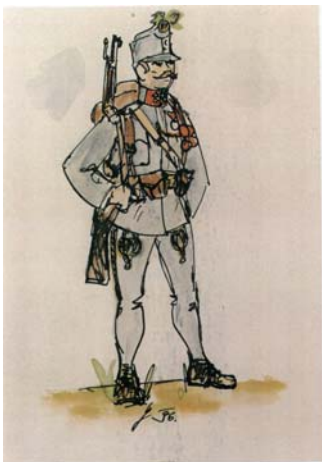
Desiatnik 71. pešieho pluku v poľnej rovnošate z r. 1914

Na kresbách PhDr. Vogeltanza sú rovnošaty s egalizáciou 71. pešieho pluku.