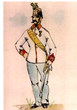
Nadporučik v spoločenskej rovnošate z r. 1861 – 1867