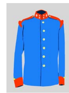
desiatník 1. pluku B.H. strelcov

Pluky v rakúsko-uhorskej armáde sa odlišovali farbou a strihom rovnošaty, farbou výložiek, vyloženia a gombíkov, rôznym označením na výložkách, názvami hodností a pod. Pre 71. peší pluk bola pridelená tmavomodrá farba blúzy so žltými gombíkmi, pre vyloženie „račia“ červená. Rovnaká farba pre blúzy, vyloženie a gombíky boli pridelená ešte aj pre peší pluk č. 35 („rakúsky“) – pešie pluky č. 20 („rakúsky“) a 67 („uhorský“) tiež rovnaké vyloženie, ale sa odlišovali od peších plukov i č. 35 a 71 gombíkmi bielej farby.