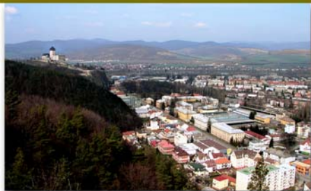
Bývalá kasáreň 71. pešieho pluku v Trenčine. Pohľad z vyhlíadky v lesoparku Brezina.