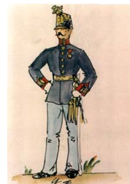
Nadporučik v spoločenskej rovnošate z r. 1900 – 1914