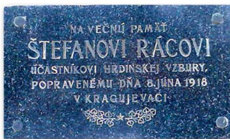
Nápis na pamätnej tabuli Štefana Ráca