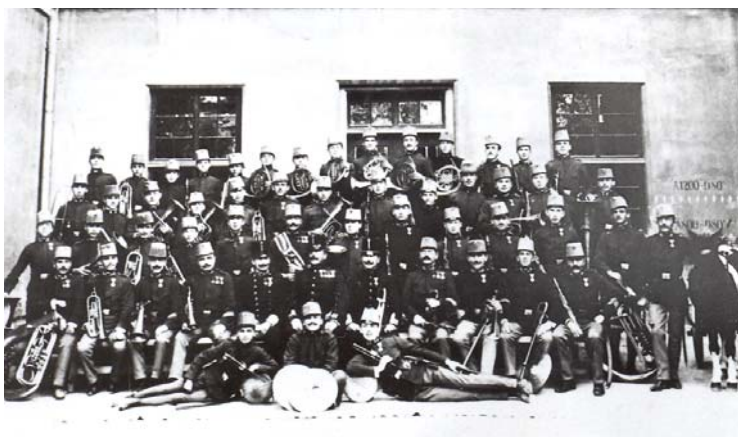
Plukovná hudba 71. pešieho pluku

Od roku 1883 bol 71. peší pluk (v zložení 2. – 4. prápor) spolu so 72. peším plukom a 1. práporom pionierskeho (ženijného) pluku začlenený do zostavy 27. pešej brigády 14. pešej divízie V. armádneho zboru (ich veliteľstvá sídlili v Bratislave na dnešnej Dunajskej ulici). Početné stavy pluku boli v mieri a počas vojny doplňované regrútmí (odvedencami) z troch vtedajších uhorských (slovenských) žúp – Trenčianskej, Oravskej a Turčianskej. Mužstvo, prípadne poddôstojníci v zálohe, ktorí mali počas mobilizácie a vojny doplniť poľné (frontové) jednotky, boli sústredovaní v náhradnom prápore pluku, pre ktorý viedol evidenciu tzv. káder náhradného práporu (nem. Ersatzbataillonskader). Z hľadiska národnostného zloženia predstavovali Slováci v roku 1900 temer 95% a v roku 1914 asi 85% z celkových počtov kmeňového stavu mužstva pluku.