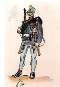
Slobodník v poľnej rovnošate z roku 1878