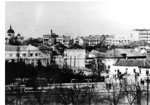
Kragujevac sa na konci 1. svetovej vojny stal miestom vzbury a masakry 44 Slovákov