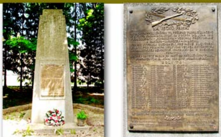
Pamätník 44 popraveným vojakom 71. pešieho pluku v kasárni SNP – súčasný stav