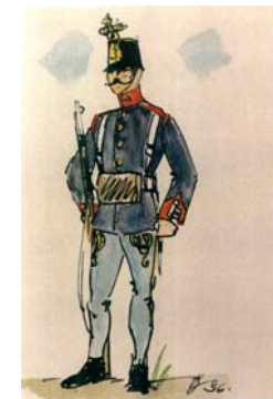
Slobodník v prehliadkovej rovnošate z r. 1867 – 1875