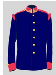
zástavník 35. a 71. pešieho pluku