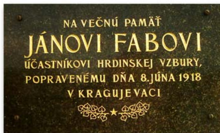
Nápis na pamätnej tabuli Jána Fabu