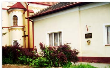
Pamätná tabuľa J. Fabu v bývalej obci Kubra