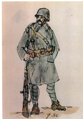
Pešiak 71. pešieho pluku v poľnej rovnošate z r. 1917-1918 s prilbou